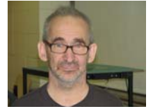
Par; Yves Cholette

Question : 1 Quel Saison préfère-tu? Pourquoi?