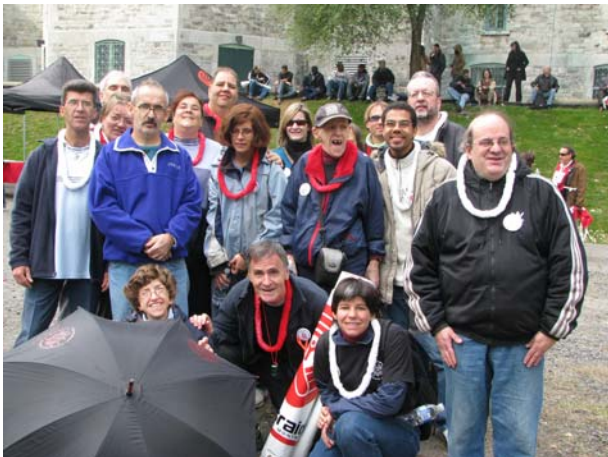
Les Membres du Mouvement