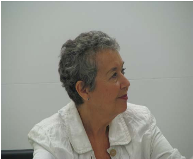
Septembre 2008 - Francine Lalonde Député du Bloc Québécois Campagne Électorale Fédérale