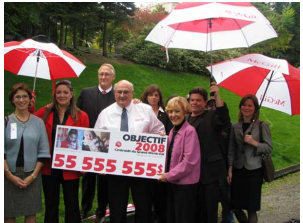
Voici l'objectif de l'année 2008