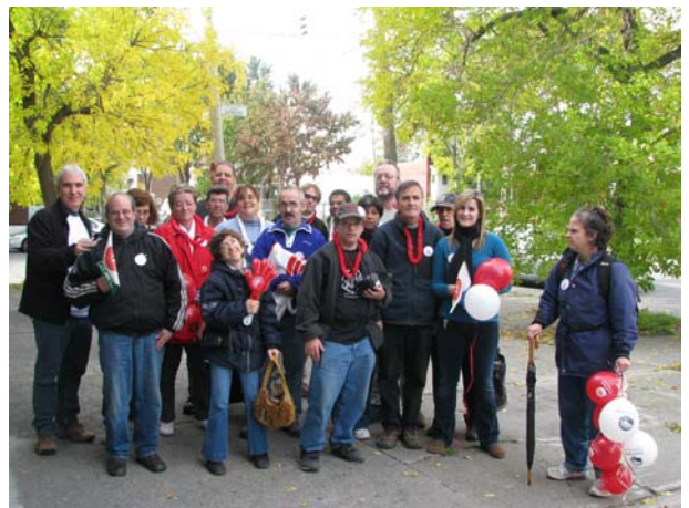
Voici la troupe des joyeux troubadours du Mouvement