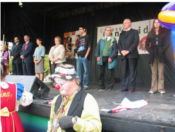
Plusieurs groupes communautaires étaient sur place avec le Maire